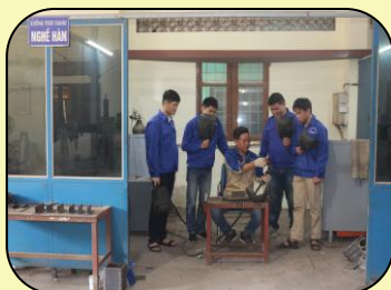
Thực hành nghề Hàn