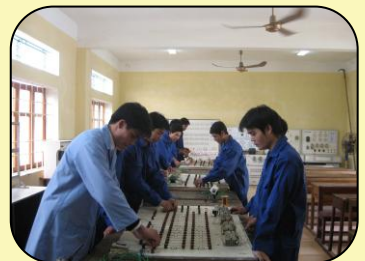
Thực hành nghề Điện dân dụng

Ngoài chức năng đào tạo nghề ở các cấp trình độ, nhà trường còn được Sở GD&ĐT Hà Nội giao chỉ tiêu tuyển sinh, đào tạo hệ GDTX cấp THPT. Học sinh được học tại khu giảng đường 4 tầng (Có thang máy) các phòng học được trang bị đầy đủ các phương tiện và thiết bị hiện đại phục vụ cho việc dạy và học (Máy chiếu, máy tính, điều hòa...).