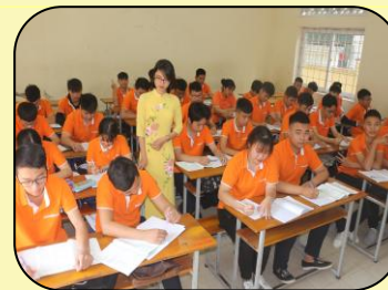
Giờ học văn hóa THPT

Ngoài chức năng đào tạo nghề ở các cấp trình độ, nhà trường còn được Sở GD&ĐT Hà Nội giao chỉ tiêu tuyển sinh, đào tạo hệ GDTX cấp THPT. Học sinh được học tại khu giảng đường 4 tầng (Có thang máy) các phòng học được trang bị đầy đủ các phương tiện và thiết bị hiện đại phục vụ cho việc dạy và học (Máy chiếu, máy tính, điều hòa...).