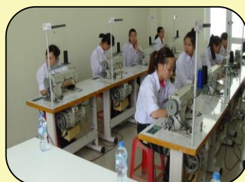
Thực hành nghề May thời trang