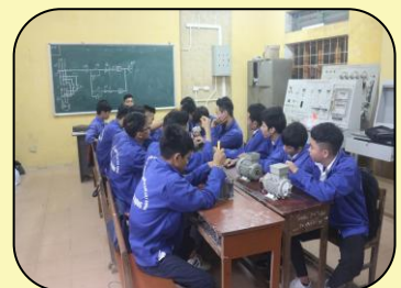
Thực hành nghề Điện công nghiệp