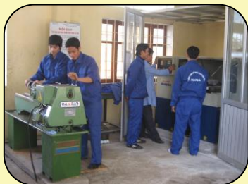
Thực hành nghề Cắt gọt kim loại