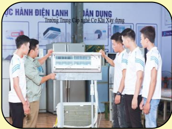
Thực hành nghề Điện lạnh

Hiện tại trường đang đào tạo nghề trình độ trung cấp, sơ cấp và ngắn hạn dưới 3 tháng thuộc các nhóm ngành: Công nghệ kỹ thuật cơ khí; Điện, điện tử, điện lạnh; Hàn: TIG, MIG/MAG; Vận hành máy xây dựng, máy công trình; May thời trang. Học sinh được thực hành tại các xưởng với đầy đủ máy móc trang thiết bị hiện đại.