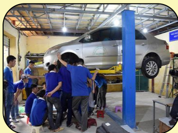
Thực hành nghề Công nghệ ô tô